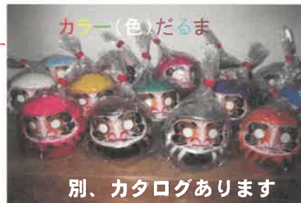
別、カタログあります